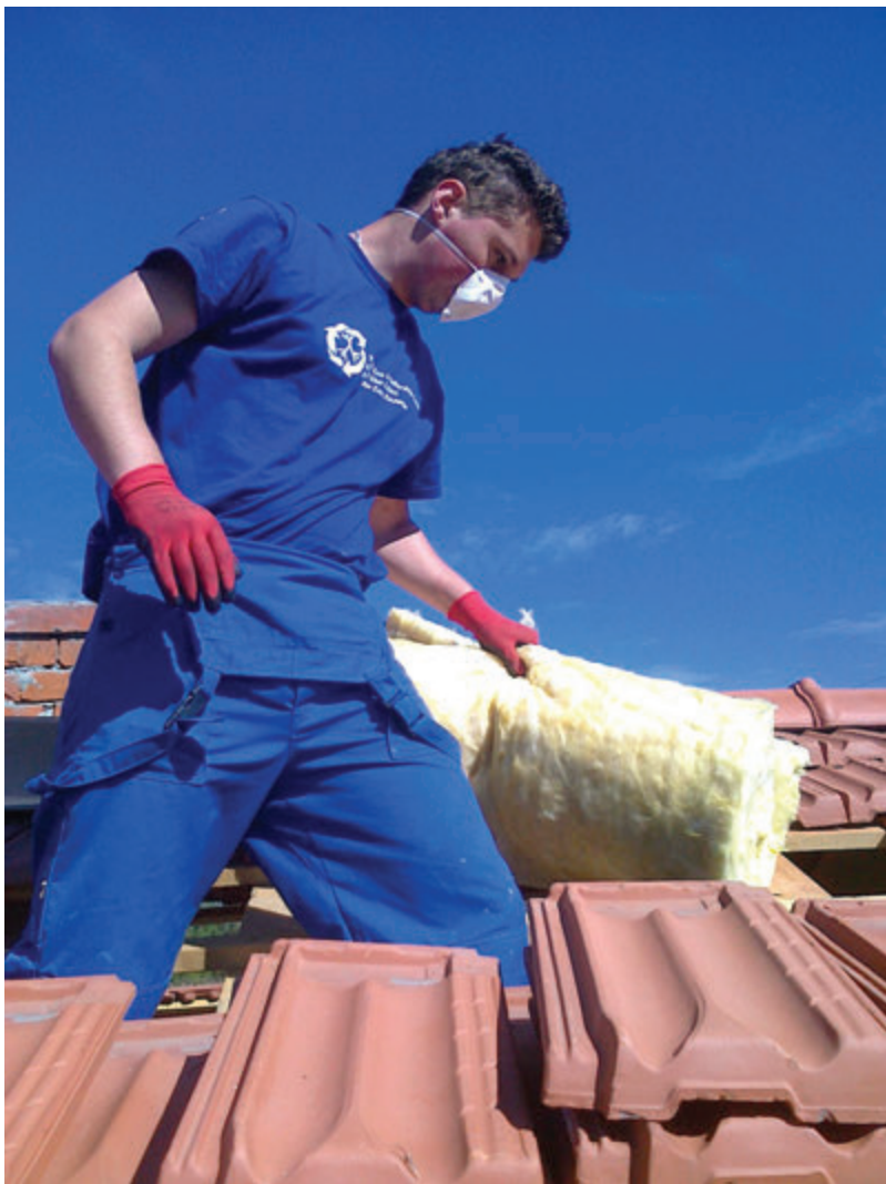
Unapređenje energetske efikasnosti objekta.

T okom terenskih radova učesnika projekta „Mladi grade budućnost u BD BiH” koji se proširio i na četiri susjedne opštine, obnovljena su ukupno 23 sportska i dječija igrališta u različitim mjesnim zajednicama, u 11 osnovnih i srednjih školama obnovljene školske prostorije obnovljeni su parkovi i zelene površine a u Brčko Distriktu je projektovano i izgrađeno novo dječije igralište. Kroz projekat „Mladi eko lideri”, u 18 opština oba entiteta a uključujući i Brčko Distrikt, unaprijeđena je lokalna infrastruktura, izrađeno je i postavljeno 27 trostrukih kontejnera za reciklažu, obnovljena su dječija i sportska igrališta i sl.