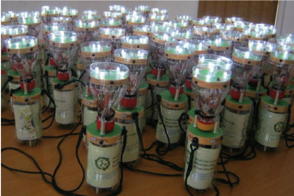
Solarne lampe od reciklažnog materijala

Centar za održivi razvoj, podržava i promoviše korištenje obnovljivih izvora energije.