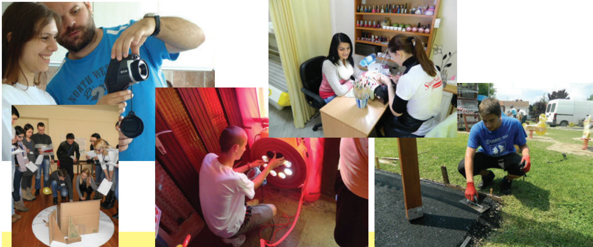
Učesnici projekta na raznim obukama i treninzima.

Više od 1000 korisnika svjedoče o uspješnosti našeg trening programa. Fokus našeg programa edukacije i treninga obuhvaća područja zelenog ili eko biznisa, energetske efikasnost, obnovljive izvore energije, “zelenu” gradnju, te razne ekološke teme.