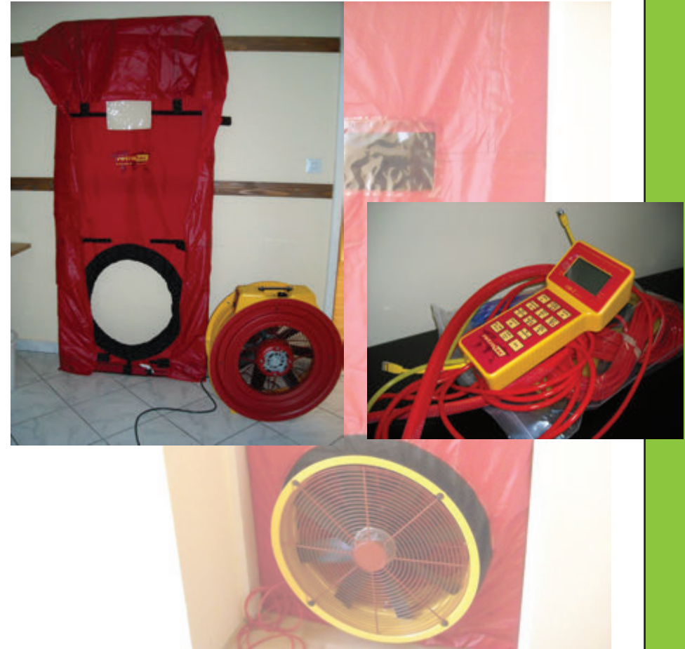
Blower door test mjeri propusnost vazduha kroz omotač objekta.

Kao dio praktičnog treninga izvršeno je unapređenje energetske efikasnosti kod 30 stambenih jednorodničkih objekata iz kategorije socijalno ugroženih porodica.