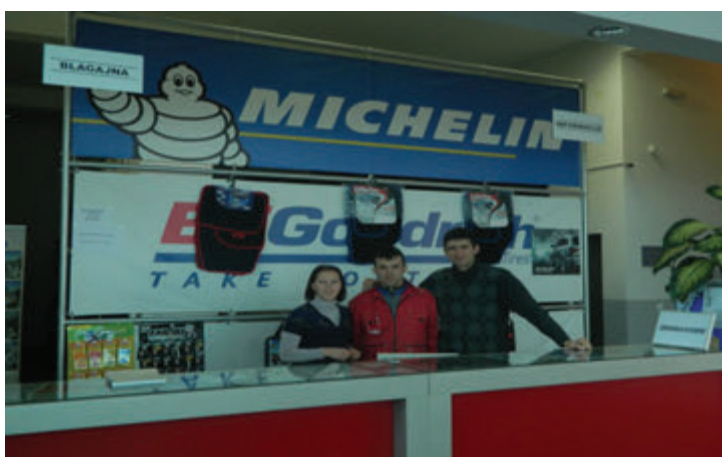
Učesnici projekta na radnoj praksi.

Čvrsto vjerujemo da poslovna zajednica i lokalna vlast imaju važnu ulogu u rješavanju problema održivog razvoja jedne lokalne zajednice.